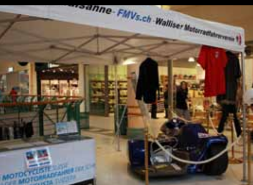
Expo des 90 ans

Fédération Motorisée Valaisanne - Printemps 2011 - No 23