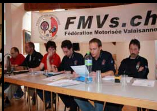
AG FMVs 2011