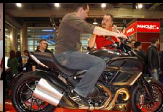
Swiss Moto Zürich